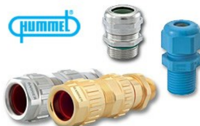
Förskruvningar från Hummel

Vi hjälper dig med kabelförskruvningar för